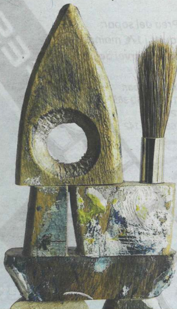
imatge: Imma Vifais