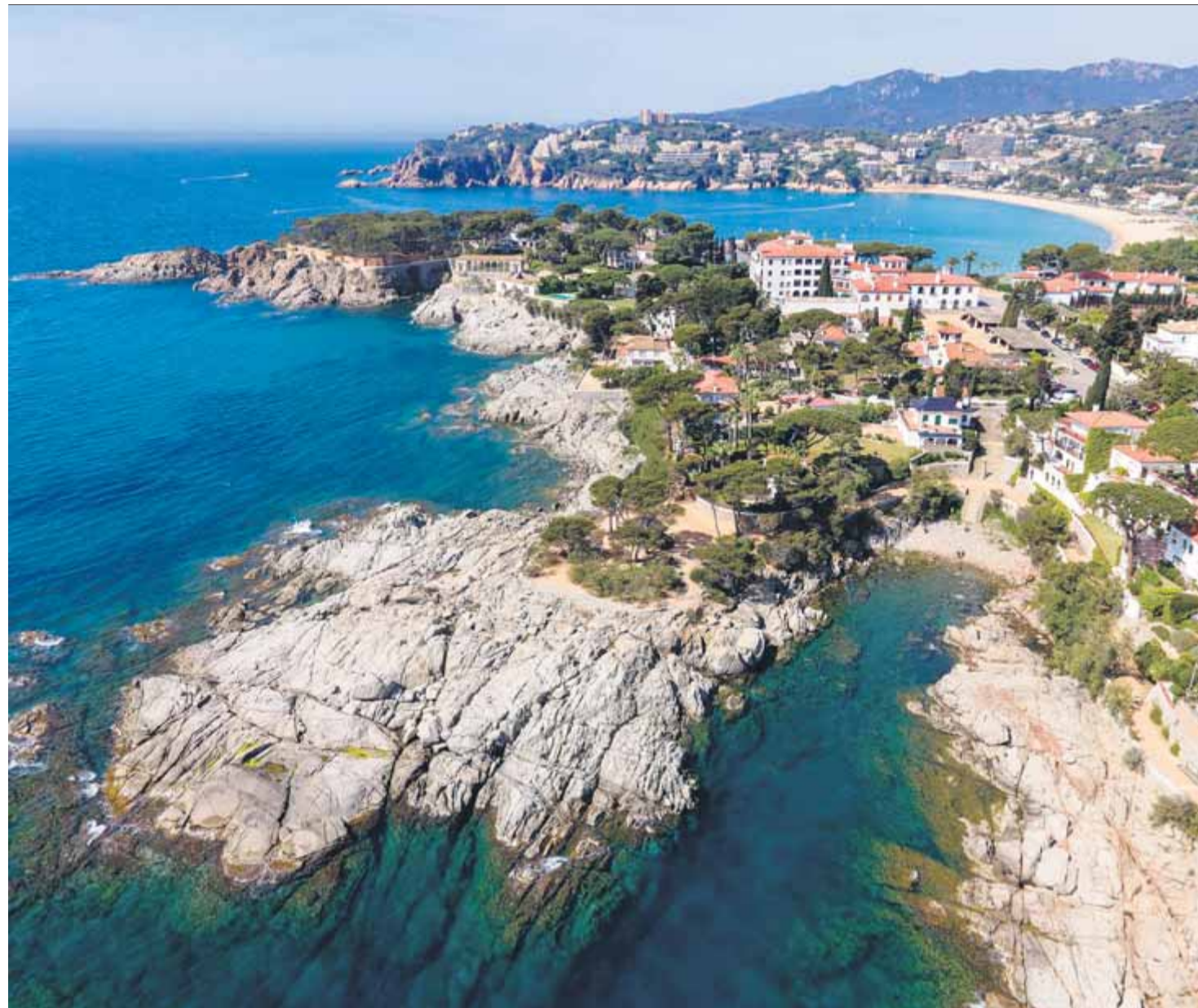
Vista aèria general del que es coneix com a s'Agaró Vell, la urbanització embrionària traçada sobre els plànols per l'arquitecte gironí Rafael Masó, tot i que amb reformes, com ara l'hostal de la Gavina o el camí de ronda, introduïdes progressivament per Francesc Folguera

mer xalet pilot, Masó va espremer i condensar diverses solucions arquitectòniques. Pareds blanques, combinades amb murs de pedra autòctona i altres materials de quilòmetre zero: ceràmica policromada de la Bisbal, columnes de terrissa negra de Quart i llindes, reixes, arcs i peces que l'arquitecte sabia on adquirir i rescatar en velles masies de l'Empordà.