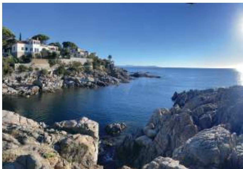
Diferents vistes de les edificacions que donen al camí de Ronda.

Castell de focs artificials. Servirà de punt final del sopar de repartiment dels trofeus del campionat de tenis i regata. L'objectiu és que els veïns del municipi i de les poblacions pròximes també puguin compartir la celebració del centenari de S'Agaró. Es farà a la Badia de Sant Pol el 15 d'agost de 2024.