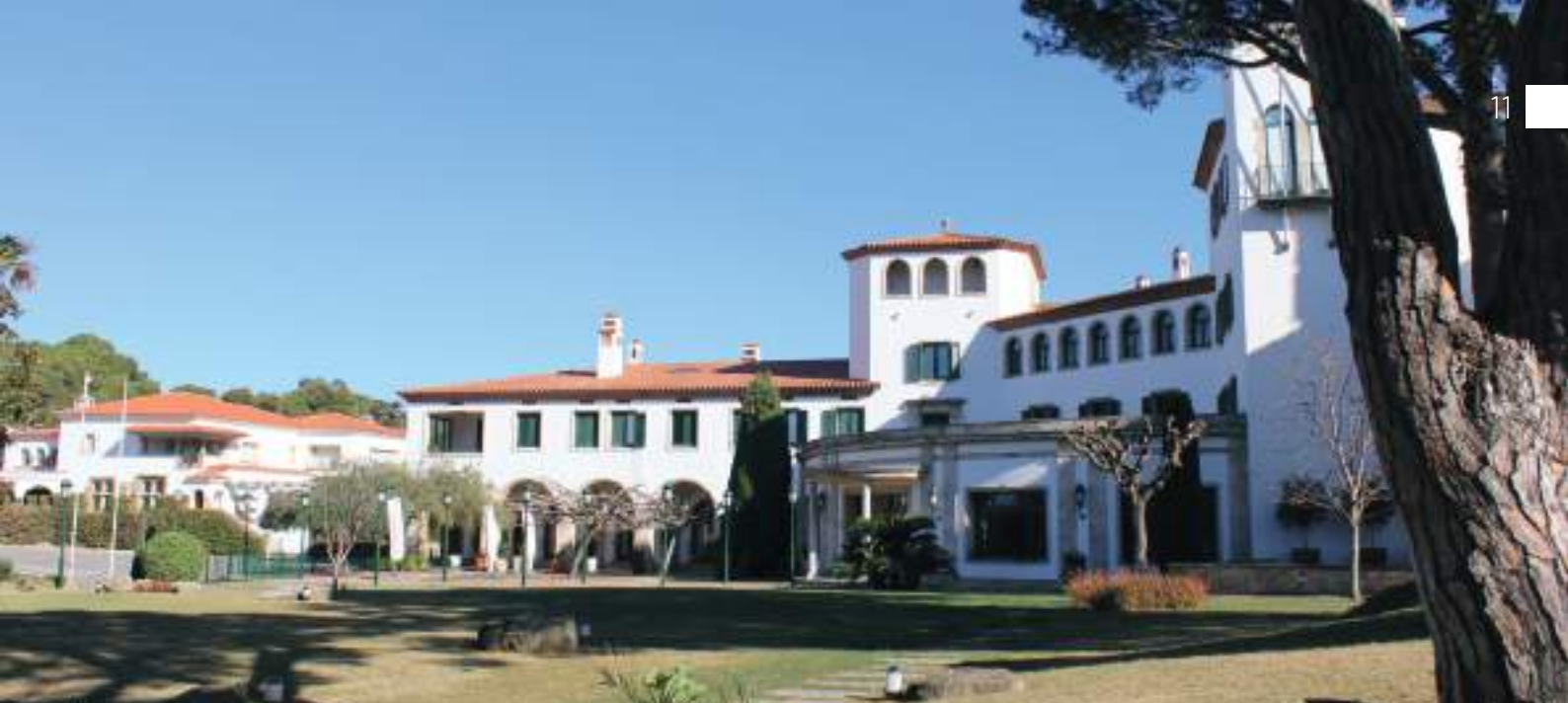
Exterior de l'Hostal de La Gavina, de cinc estrelles Gran Luxe.

millors i ampliacions fins a arribar a les 74 habitacions, l'Hostal s'ha posicionat per mèrits propis entre els millors establiments privats del món hotelier a escala internacional. L'hotel ha afegit a les seves instal·lacions un balneari, una piscina exterior, restaurants i un espai per a reunions. Des dels seus inicis, l'establiment es va convertir en un punt de trobada de l'alta burgesia, en un principi només catalana, però aviat va assolir fama internacional. L'Hostal de La Gavina sempre ha estat vinculat a la família Ensesa, que ara és dirigit per la quarta generació de la família.