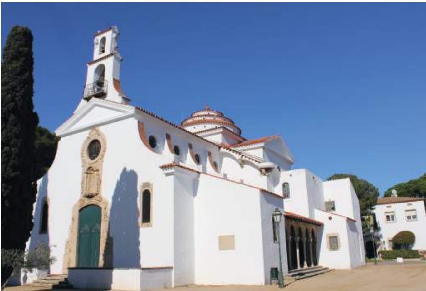
Església de Nostra Senyora de l'Esperança. La construcció, d'estil neobarroc projectada per l'arquitecte Folguera, està dedicada a la Mare de Déu de l'Esperança.

El Pla Especial de Protecció de S'Agaró és un instrument derivat del POUM i regula l'àmbit de les 52,9 hectàrees de la ciutat residencial fins al darrer detall. Regula els materials, colors, cromatismes o acabats a emprar en façanes i cobertes que s'han utilitzat al llarg d'un segle al S'Agaró Primitiu així com en la seva ampliació en l'àmbit de Pineda Balmanya i S'Agaró Hotel, i darrerament en l'àmbit de Sa Conca.