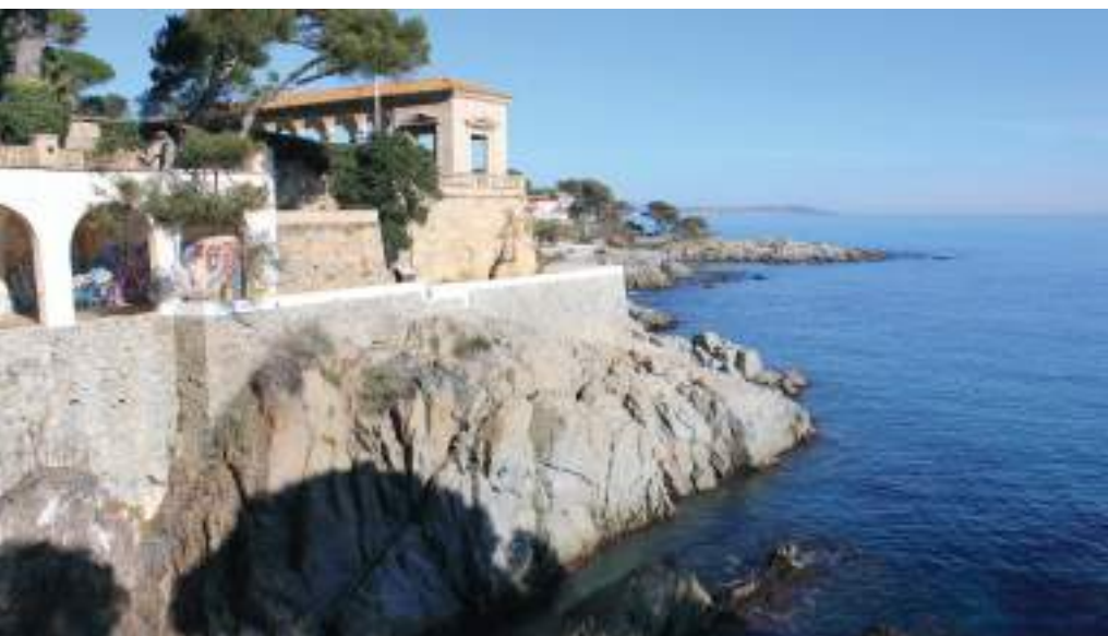
Vista del camí de Ronda, en primer pla Loggia de Senya Blanca d'estil Brunelleschià.

Arran de la primera casa, es va plantejar la construcció d'una petita ciutat residencial basada en l'estil noucentista de Masó. El primer nucli d'habitatges de S'Agaró estava format per sis cases i es va situar al voltant de la plaça del Roserar. Com que dos dels xalets inicials no es van vendre, Ensesa va veure l'oportunitat d'unir-ne dos i convertir-los en l' Hostal de La Gavina . L'arquitecte noucentista va optar per fer l'hotel molt diferent dels habituals: va apostar per una caseta acollidora, una mena de casa rural catalana, sobretot pel que fa als interiors. El complex hotelier va obrir les portes per primera vegada el 2 de gener de 1932 i només disposava d'11 habitacions. Després d'importants