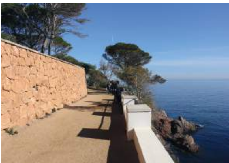
Diferents vistes del camí de Ronda.