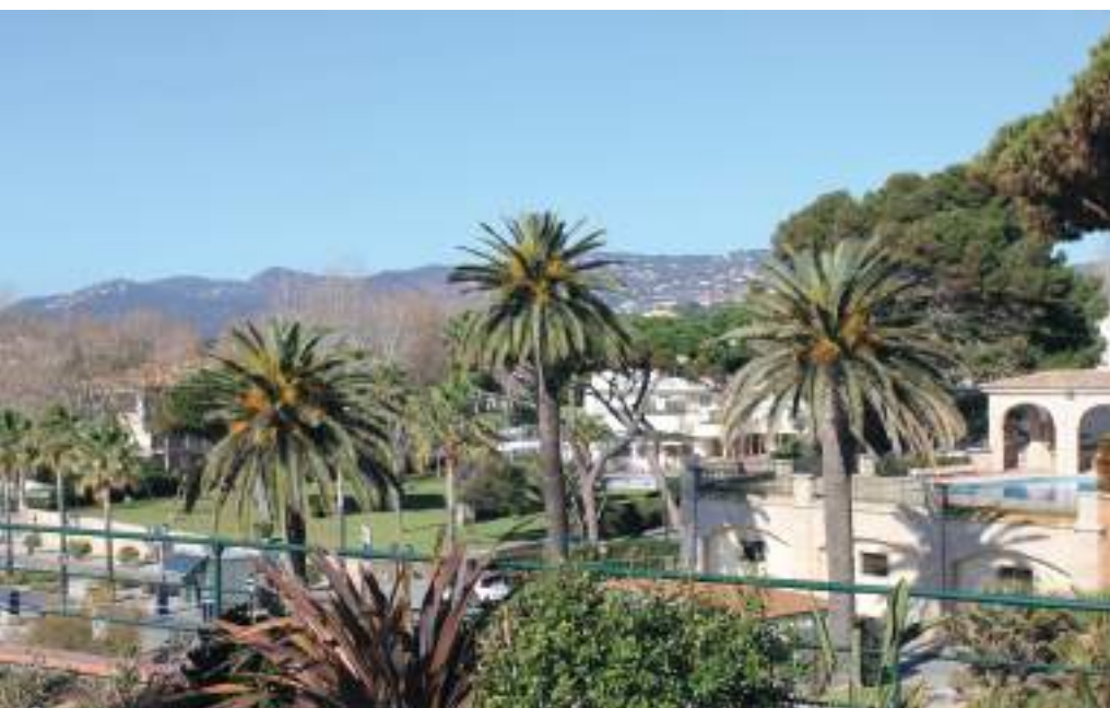
Vista dels jardins de S'Agaró Hotel de quatre estrelles.

Josep Ensesa i Gubert va morir l'1 de gener de 1981 i, d'aquesta manera, es posava punt final a la història d'un pioner que va impulsar i costejar una obra faraònica com va ser la construcció de la urbanització de S'Agaró. El seu llegat, però, va continuar amb els seus successors, que van continuar amb la visió de la ciutat-jardí de S'Agaró. El 28 de novembre de 1995, quan havien passat més de setanta anys de la construcció de Senya Blanca, el conjunt va ser declarat Bé Cultural d'Interès Nacional per garantir la seva preservació.