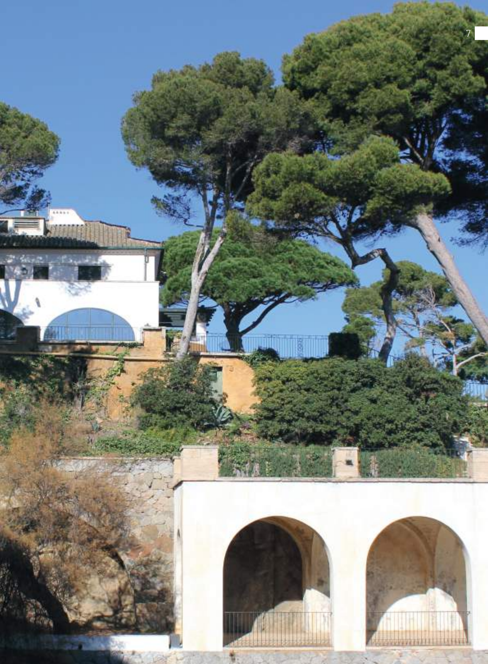
La primera construcció de la urbanització va ser el xalet de Senya Blanca.