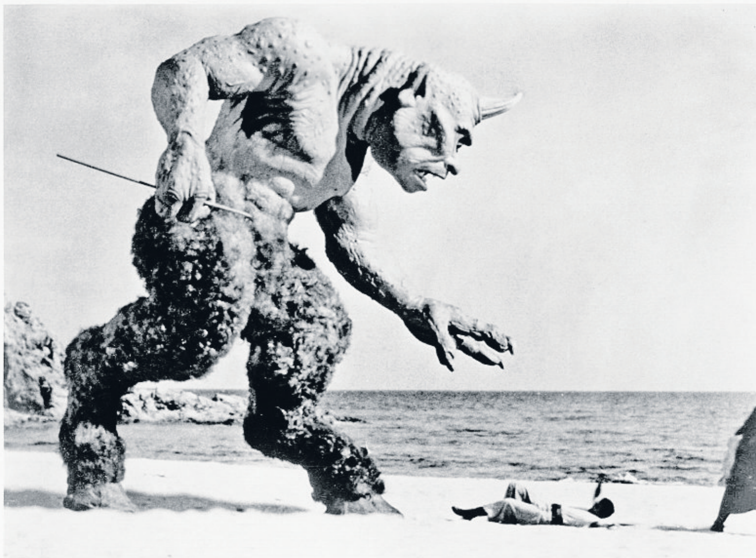
COLLEMSIA PICTURES presents "THE 7th VOYAGE OF SINBAD" starring KERWIN MATHEWS • KATHRYN GRANT and co-starring RICHARD EYER, as The Giant.

Una muestra resigue los filmes rodados en el enclave, de los años 40 hasta hoy