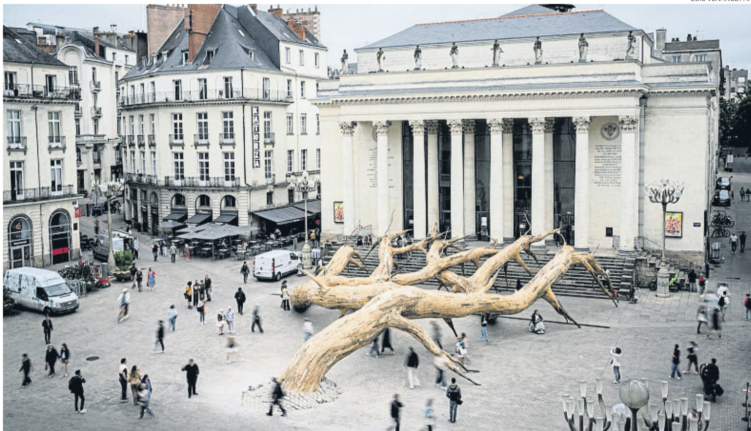
França i el seu art. L'espectacular obra Le Rêve de Fitzcarraldo , d'Henrique Oliveira, s'exposa davant l'Òpera de Nantes, com a part del festival Voyage à Nantes que se celebra del 6 de juliol al 8 de setembre