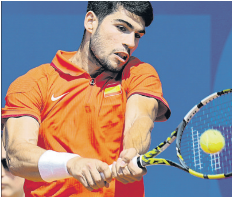
Carlos Alcaraz, tras la tierra de los Juegos Olímpicos, la pista dura de Cincinnati